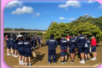
金武町億首川にて マングローブ林の観察