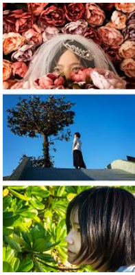
タイトル 「土曜日のひととき」