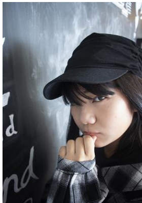
タイトル「Don't think, feel.」